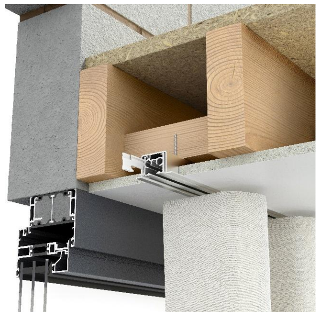
Profilo da incasso + Profilo binario + inserto