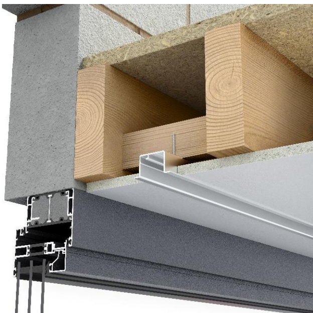
Profilo da incasso

I profili incassati non sono preforati per consentire flessibilità nella distanza tra i travetti. I profili sono realizzati in alluminio e possono essere facilmente forati.